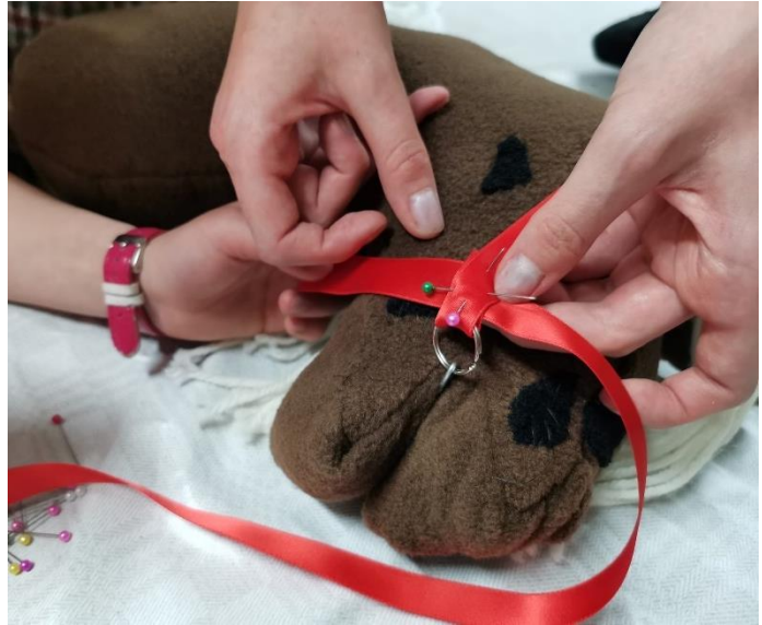
Kuvat 9-10 Keppiheppa-kesäkerho

Aulavastaavana toimineen työkokeilijan palaute: