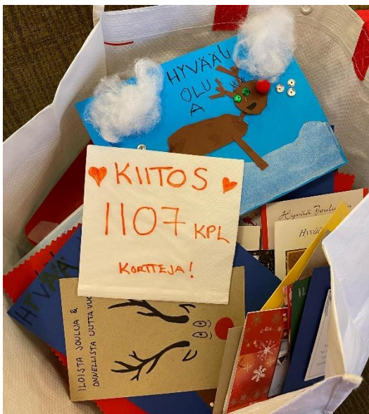
Kuva 11 Joulukorttikeräyksen saldoa

Lahjoita pieni pala jaksamista! Kymenlaakson Syöpäyhdistys järjesti suklaalevy keräyksen syöpäsairaille joulukuussa. Keräyksen tuotto lahjoitettiin Kymenlaakson Keskussairaalan syöpätautien hoitoyksiköihin. Kumppanuustalo Hilma toimi yhtenä keräyspisteistä. Hilma järjesti yhdessä Haminan seurakunnan kanssa villasukka -keräyksen Ukrainaan. Sukkia, lapasia ja pipoja, toimitettiin lopulta autolastillinen seurakunnalle. Yhdessä SPR:n kanssa toteutettiin Apupupu-keräys. Apupupuja saatiin kaikkiin 33 kappaletta ja ne toimitettiin lähialueen vastaanottokeskuksien lapsille. Apupuput ovat siis kaikki käsin tehtyjä.