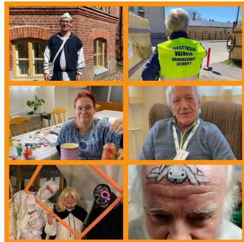
Kuva 2 Toiminnan mahdollistaa meidän ihanat vapaaehtoiset!

Kumppanuustalo Hilma sijaitsee Haminan keskustassa, varuskuntakerhon kiinteistössä. Isot ja monipuoliset tilat vastaavat hyvin erilaisiin tarpeisiin ja ovat helposti muunneltavissa. Hilman tilojen käyttästeessä näkyi vielä 2022 vuoden alkuneljänneksellä koronapandemian vaikutukset.