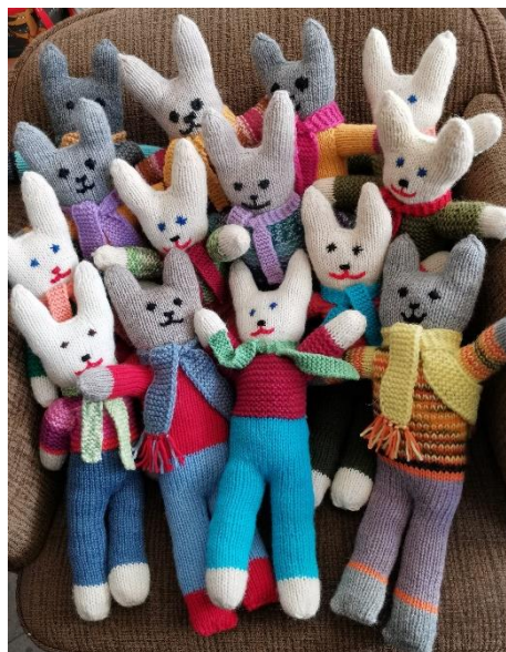
Kuva 12 Apupupu poikineen!