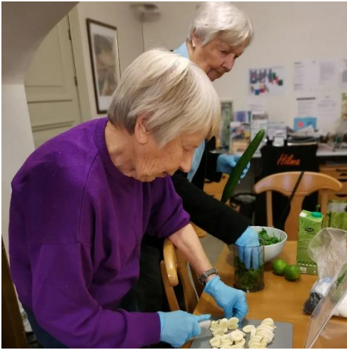
Kuva 3 Kymenlaakson Marttojen, Vireästi Kaakossa -toiminta vierailulla Hilman kohtaamispaikassa.

Vuoden 2022 suurin uudistus oli avoimen kohtaamispaikkatoiminnan kehittäminen yhteistyössä Haminan kaupungin kanssa. Lähellä sijainnut kaupungin Puistokamarin kohtaamispaikka siirtyi Hilmanille. Kohtaamispaikka on kaikille avoin olohuone, jossa voi lukea päivän lehdet, käyttää tietokoneita, tavata muita sekä nauttia päiväkahvit. Kohtaamispaikassa vierailee usein asiantuntijoita luennossa tai järjestämässä muuta toimintaa. Kohtaamispaikassa kokoontuu myös säännöllisesti ”kässäkerho”, sieltä saa digiopastusta sekä pääsee osallistumaan tuolijumppaan.