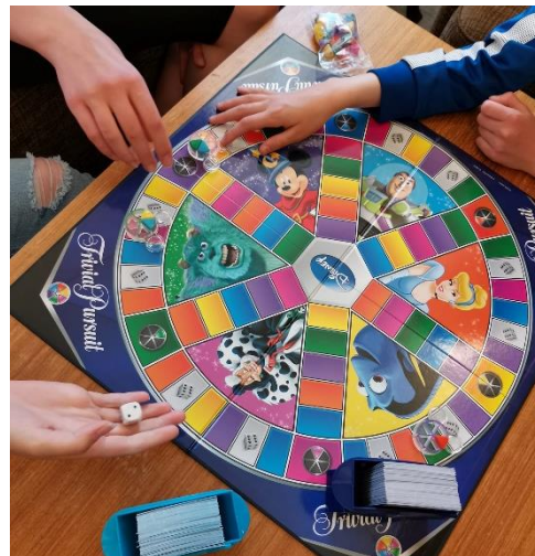
Kuva 8 Lautapeliin tiimellyksessä

Digineuvonta vakiinnutti paikkansa Hilman viikko-ohjelmassa. Koronarajoitusten salliessa digineuvontaa oli tarjolla kerran viikossa. Asiakaspalautteen perusteella koetaan, että Hilmalta on saanut apua ja neuvoja. Digiopastuksessa määrälliset tavoitteet ovat täyttyneet.