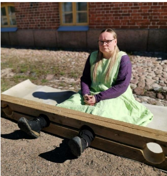
Kuva 5 Järjestösuunnittelijalle joutui Keskiäikapäivässä melkoiseen pulaan.