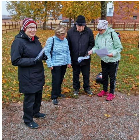
Kuva 4 Vanhustenviikolla suunnitettiin Hilman sisäpihalla