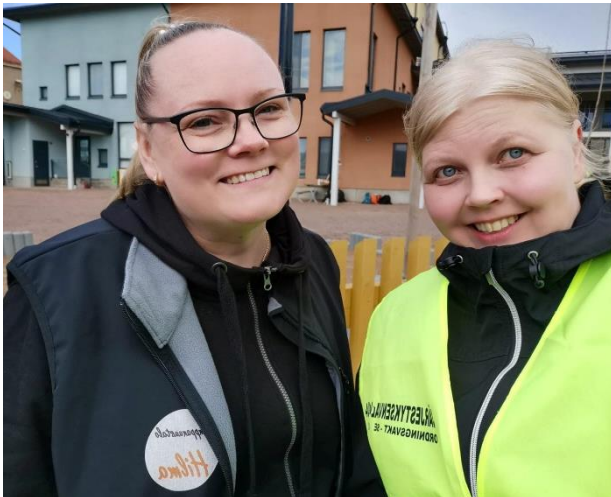
Kuva 1 "Hilmalaiset" huhtihulinoimassa

Hilman toiminnan tarkoituksena on kehittää alueellisesti Haminassa toimivien yhdistysten välistä yhteistyötä sekä parantaa yhdistystoiminnan edellytyksiä. Yhdistystoimintaa kehitetään esimerkiksi tarjoamalla yhdistyskäyttöön edullisesti kokous- ja harrastetiloja, avustamalla toiminnan markkinoinnissa ja tiedottamisessa sekä järjestämällä koulutuksia ja infotilaisuuksia tarvelähtöisesti kiinnostavista asiakokonaisuuksista. Hilmalla järjestetään myös erilaisia tapahtumia ja kaikille avoimia luentotilaisuuksia yhteistyössä eri yhdistysten kanssa. Hilma osallistuu aktiivisesti Haminassa järjestettäviin tapahtumiin sekä työntekijät ovat edustajina erilaisissa työryhmissä.