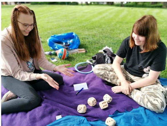
Kuva 7 Kesätyönuoret tosi toimissa

Iloa Arkeen-toiminnalla vastattiin tarpeeseen. Palautekyselyjen kautta huomattiin toiminnan olevan tarkoitusta vastaavaa. Toimintaa kehitettiin edelleen ja toimimattomista ryhmistä luovuttiin. Iloa Arkeen – toiminnan toteuttamiseen osallistui vapaaehtoistoimijat ja yhdistykset sekä kesällä kesäseteleillä palkatut nuoret. Iloa Arkeen-toiminnalla lisättiin hyvinvointia ja tuettiin jaksamista. Yhteistyökumppaneiden kanssa tehdyllä tiedottamisella, tavoitettiin kohderyhmä ja tuettiin heidän jaksamistaan. Asiakkaiden toiveesta perustettiin myös naisille oma tarinaryhmä. Ryhmä kokoontui loppuvuodesta kerran viikossa ja se koettiin omaa hyvinvointia lisääväksi ja voimaannuttavaksi.