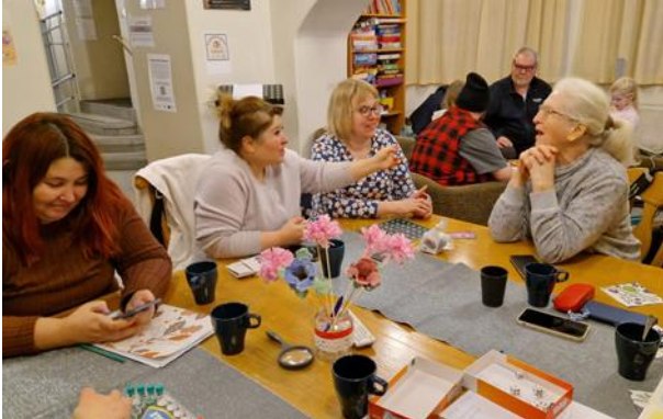
Kuva 5 Juttutuvan pelihetki

Harrasteryhmänä on ensi vuonna syntymässä Hilman puutarhakerho yhteistyössä K60 Kulttuuripajan kanssa. Haminan Keskiaikaiset jatkoivat matalankynnyksen harrastetoiminnan tarjoamista. Keskiaikaiset toimivat historian elävöittäjiä usein eri tapahtumissa ja löysivät tätä kautta toimintaansa mukaan myös uusia ihmisiä.