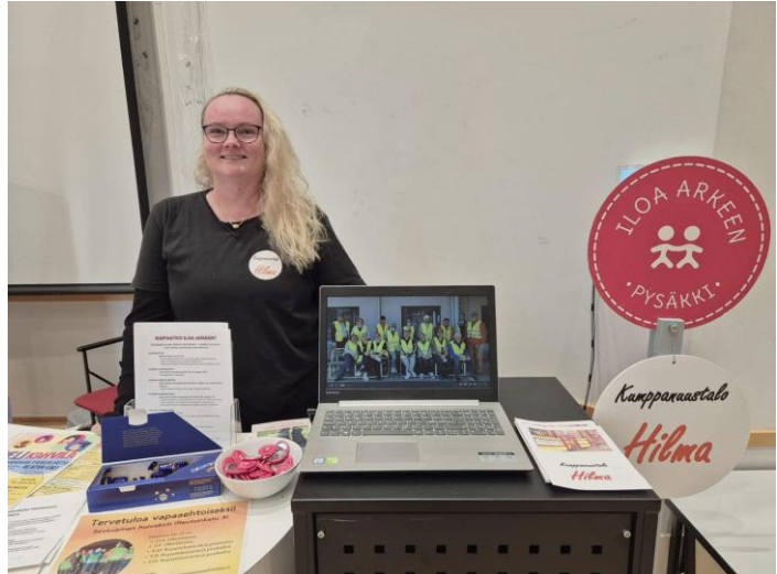
Kuva 12 Vapaaehtoismessujen esittelypöytä