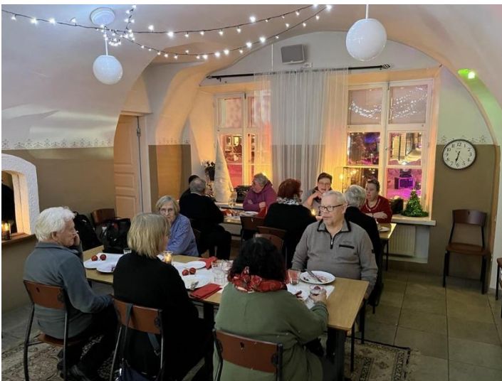
Kuva 1 Hallituksen joulukokous

Hilman Järjestöt ry:llä on vakituisesti töissä toiminnanjohtaja sekä järjestösuunnittelija. Hilman Järjestöt ry työllistää mahdollisuuksien mukaan myös pitkäaikaistyöttömiä, tukityöllistettyjä ja työkokeilijoita sekä tarjoaa mahdollisuuksia opiskelijoille suorittaa työharjoittelua. Oppilaitosyhteistyötä tehtiin Kaakkois-Suomen AMK:n ja opistoasteella Ekamin kanssa. Vuonna 2024 Hilman Järjestöt ry työllisti palkkatuella kuoron henkilön aulavastaavaksi. Vuoden aikana Hilmassa oli kaikkiaan työharjoittelussa kahdeksan opiskelijaa. Työskentely ja harjoittelu suoritettiin Kumppanuustalo Hilmassa. Kesällä palkattiin lisäksi viisi nuorta Haminan kaupungin kesäseteleillä lasten kesäkerhon ohjaajiksi.