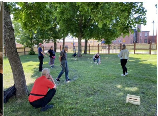
Kuva 10 Pihapeleissä oli vuorossa mölkkyy