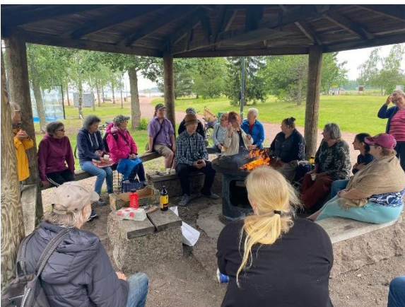
Kuva 7 Kesäretkellä Tervasaaressa.