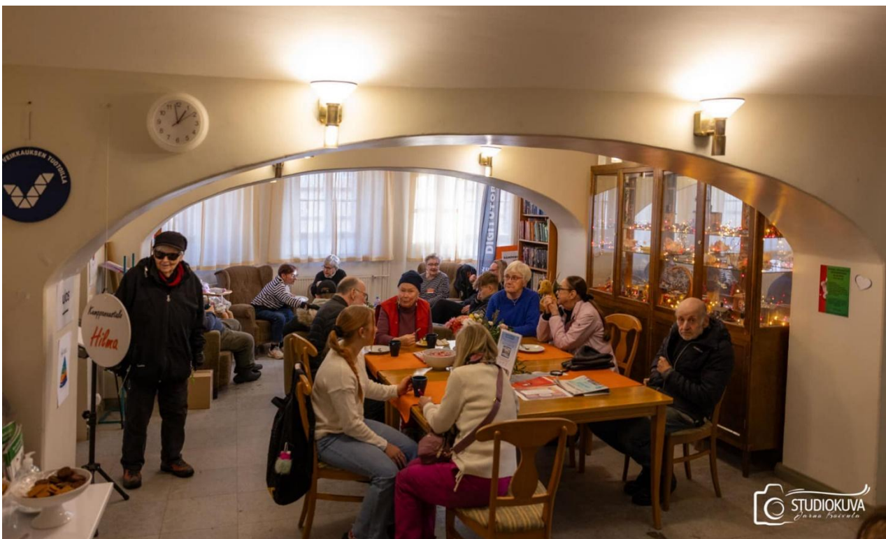
Kuva 3 Kumppanuustalo Hilman olohuone toimii kohtaamispaikkana

Hilman toiminnan tarkoituksena on kehittää alueellisesti Haminassa toimivien yhdistysten välistä yhteistyötä sekä parantaa yhdistystoiminnan edellytyksiä. Yhdistystoimintaa tuettiin tarjoamalla yhdistyskäyttöön edullisesti kokous- ja harrastetiloja, avustamalla toiminnan markkinoimisessa ja tiedottamisessa sekä järjestämällä koulutuksia ja infotilaisuuksia tarvelähtöisesti kiinnostavista asiakokonaisuuksista. Hilman olohuone toimii kaikille avoimena kohtaamispaikkana maanantaista perjantaihin. Hilma järjestetään myös erilaisia tapahtumia ja kaikille avoimia luentotilaisuuksia yhteistyössä eri yhdistysten kanssa. Hilma osallistuu aktiivisesti Haminassa järjestettäviin tapahtumiin. Hilman työntekijät ovat edustajina erilaisissa työryhmissä. Kumppanuustalo Hilma sijaitsee Haminan keskustassa, varuskuntakerhon kiinteistössä. Isot ja monipuoliset tilat vastaavat hyvin erilaisiin tarpeisiin ja ovat helposti muunneltavissa.