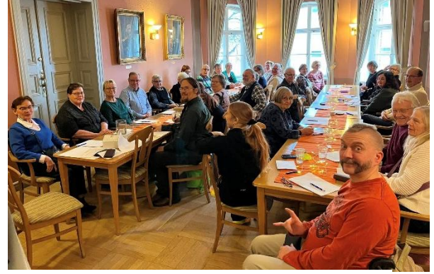
Kuva 5 Syksyn vapaaehtoisten palaute- ja kehittämistyöpaja