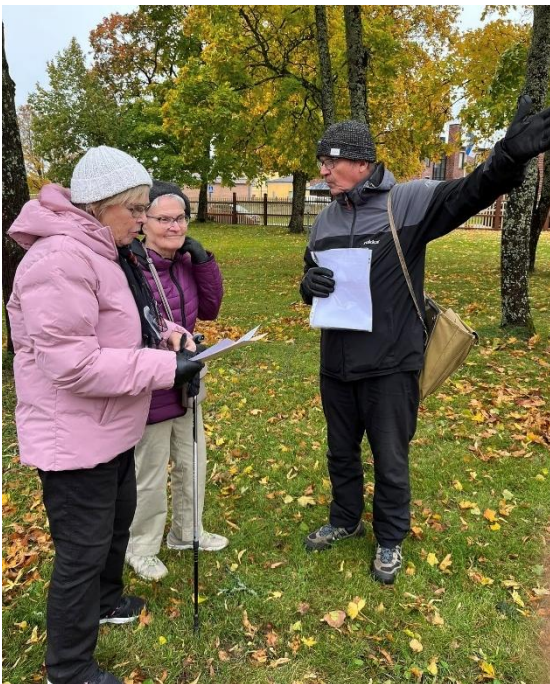
Kuva 11 Vanhustenviikon kummitussuunnistusta.