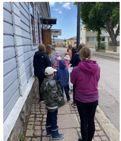
Kuva 2 Kesänuoret ja leiriläiset tutustumassa Haminan historiaan.