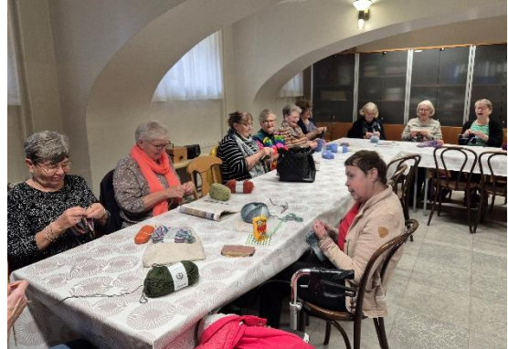
Kuva 6 Kässäkerhossa tärkeintä on toisten kohtaaminen