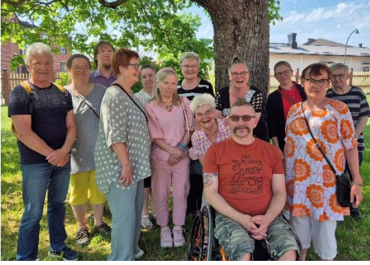
Kuva 4 Vauhtia vapaaehtoisuuteen, kevään virkistys- ja suunnittelupäivä